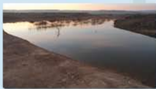
Sariñena 07- 30T N. 733513-4625223