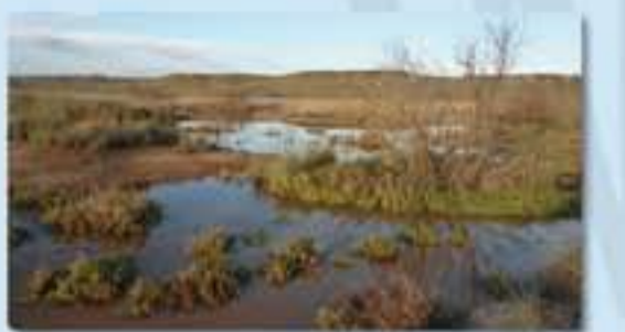
Sariñena 08 - 30T N. 731054-4624857