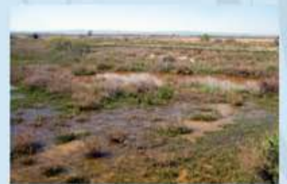
Lalueza 02- 30T N. 727562-4639458