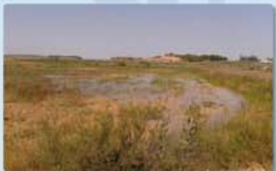
Lalueza 07- 30T N. 728522-4633554