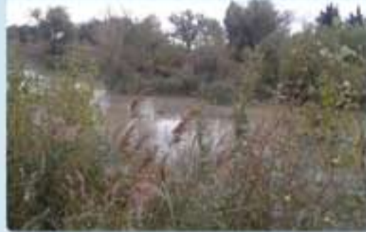
Sangarrén 01 - 30T N. 713018-4656798