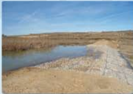
Lalueza 05- 30T N. 727278-4635184