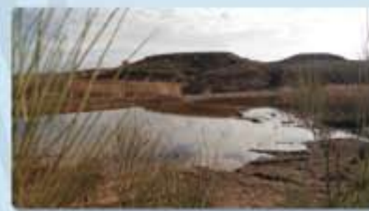
Sariñena 09 - 30T N. 732063-4624443