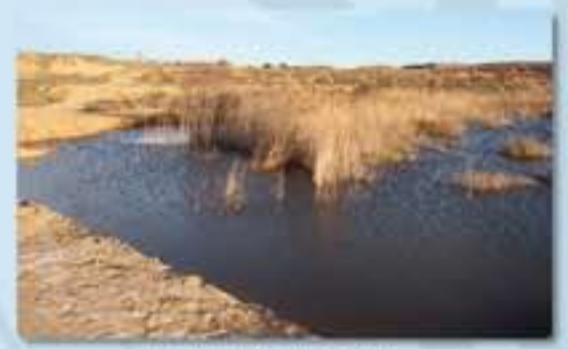
Capdesaso 30T N. 733185-4636547