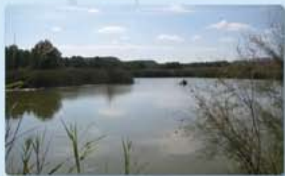
Poleñino 30T N. 721609-638048