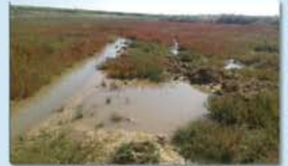
Sangarrén 03- 30T N. 710886-4655114