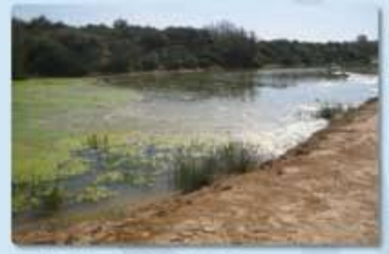
Grañén 30T N. 720172-4645102