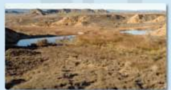
Albalatillo 30T N. 736775-462440