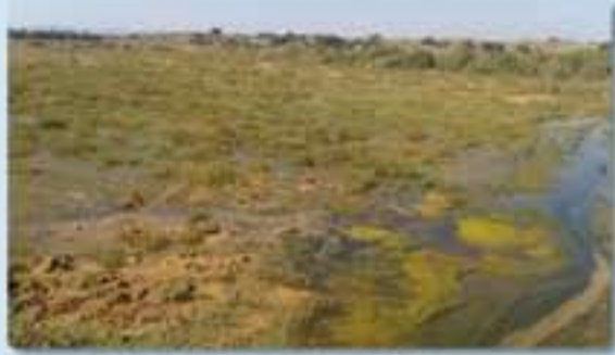
Sangarrén 04- 30T N. 714483-4654277