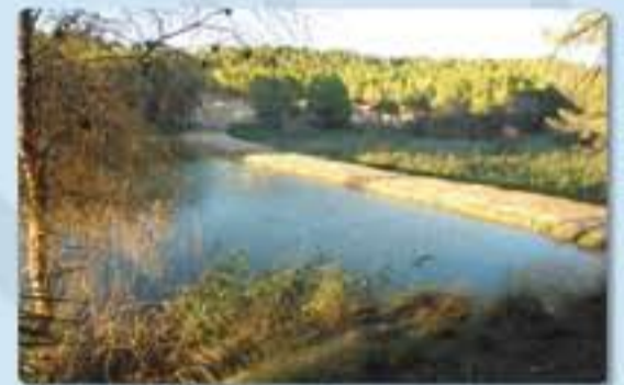
Sariñena 03- 30T N. 732129-4629370