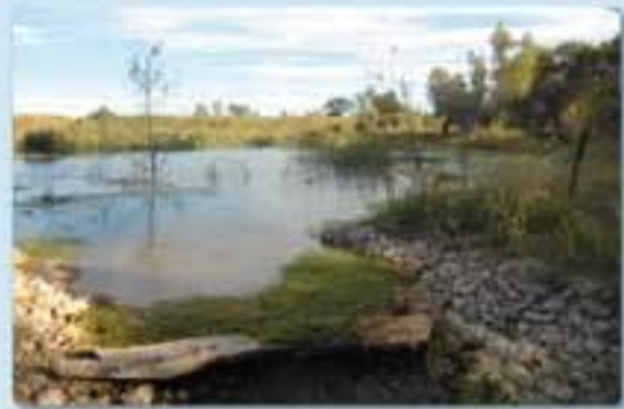
Barbués 30T N.