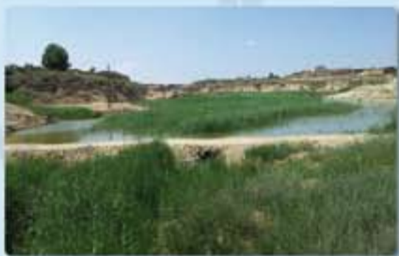
Lalueza PR2011. 30T N.